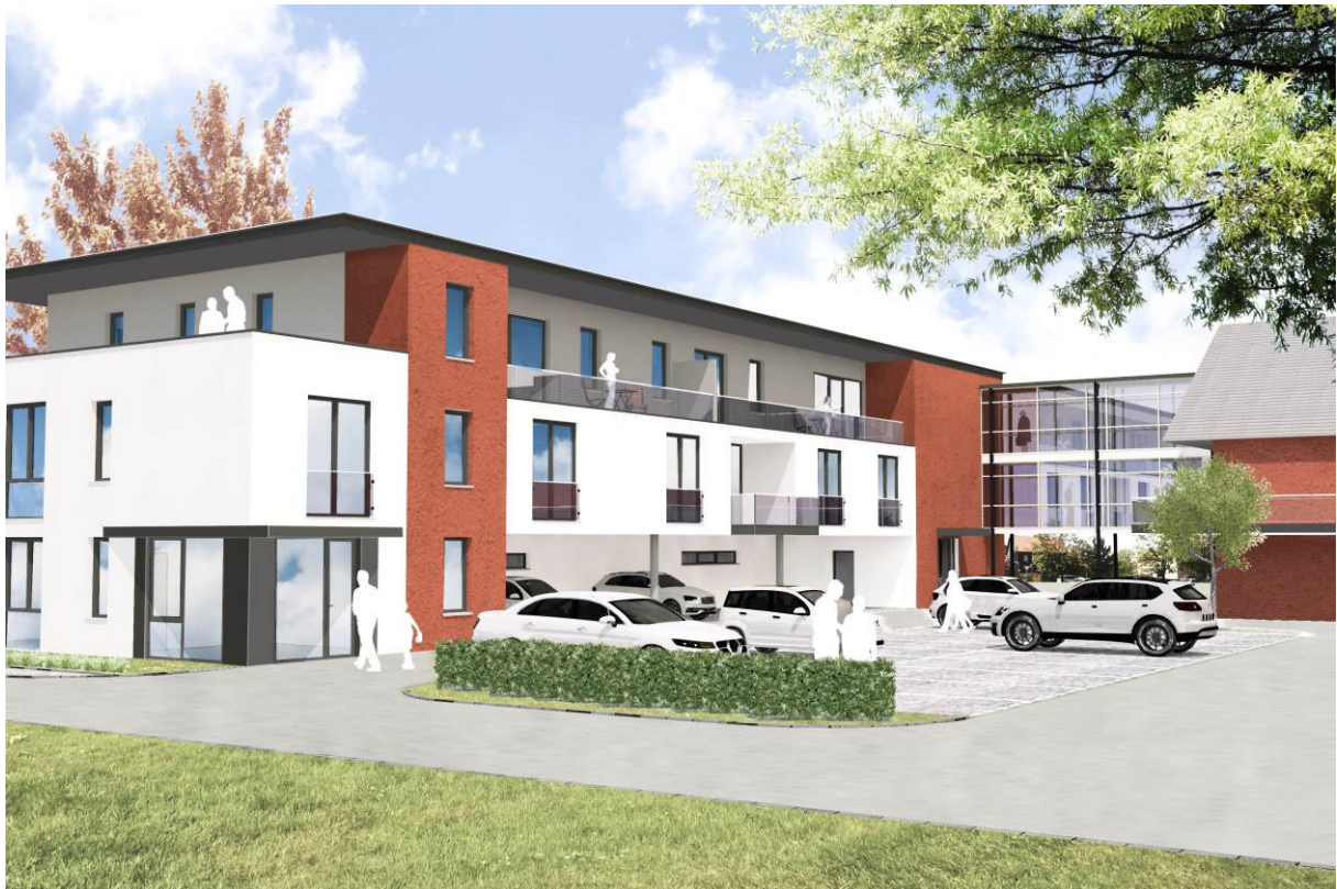
Visualisierung Ansicht Südost

Ein frei gestalteter Spielplatz für die „Jungen“ und Carportstellplätze für die „Alten“ ergänzen die Außenanlagen. Zusammen mit den bestehenden und dem neuen Baukörper entsteht ein vielseitig nutzbarer Innenhof, der sich nach außen für alle öffnet.